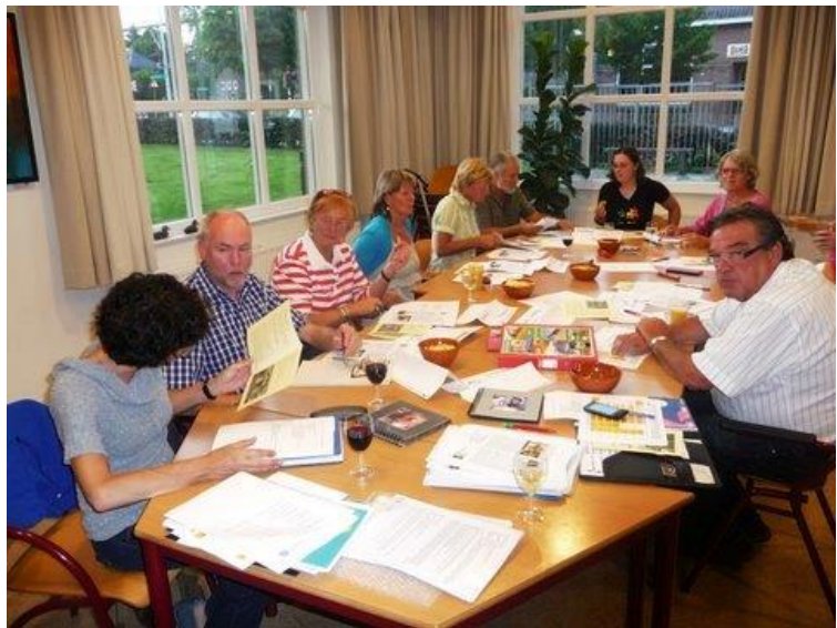
Bijeenkomst in volle gang

Op 7 juli 2011 waren 6 stichtingen uit de gemeente Rheden op uitnodiging van de SPR in De Steeg bijeen, met als doel elkaar beter te leren kennen en ervaringen uit te wisselen op allerlei gebied. Na een korte kennismakingsronde vertelden de aanwezigen beknopt iets over hun organisatie/stichting.