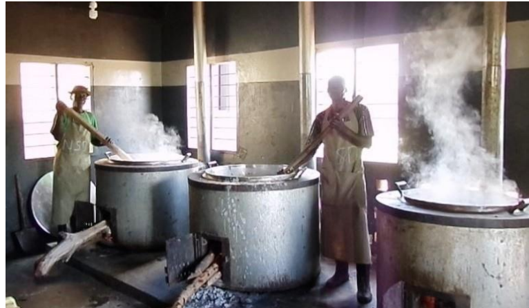
De nieuwe keuken in de Ngora Dovenschool